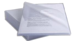
Pochette en coin